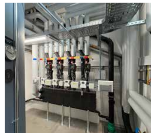
Ehemaliger Raum mit Ölheizung – heute Standort Speicher mit neuer Wärmeverteilung für die Schulanlage