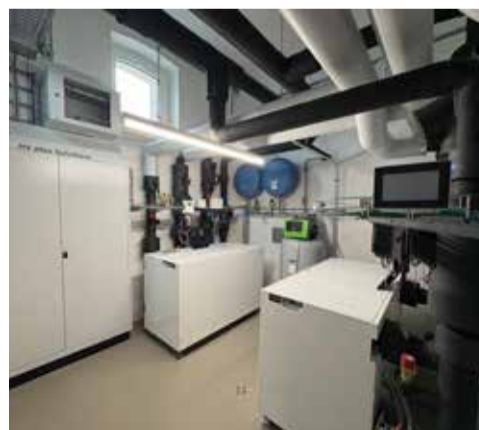
Ehemaliger Raum mit Oeltank – heute Standort der beiden Wärmepumpen

Der Gemeinderat spricht den beteiligten Firmen seinen herzlichen Dank aus – insbesondere der Bauleitung der FelberMeile AG und dem Heizungsplaner der SERO GmbH – für die einwandfreie Arbeit bei der Realisierung dieses Projekts.