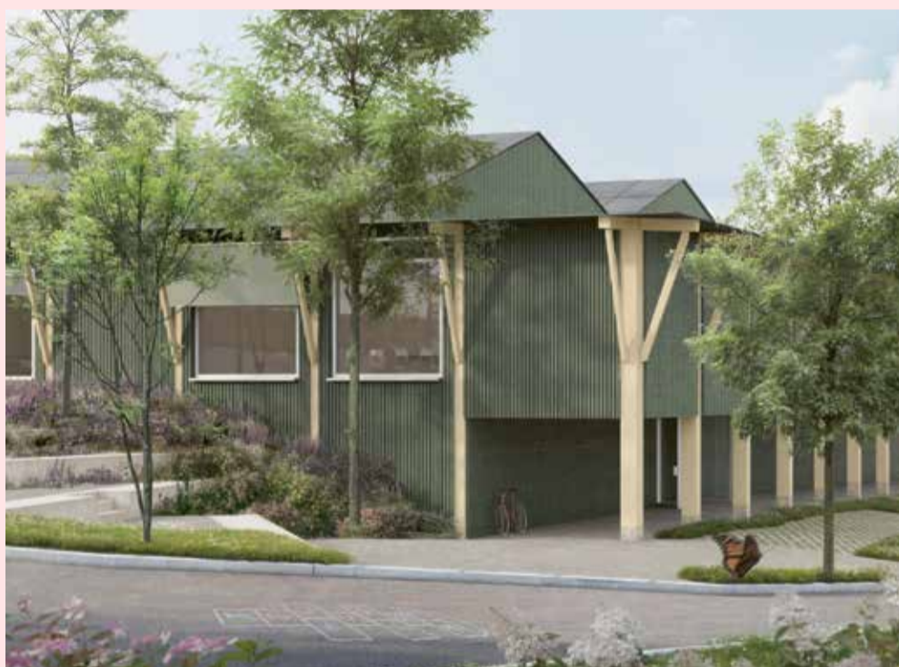
Mehrzweckhalle Breite, Visualisierung Aussenansicht Wettbewerb