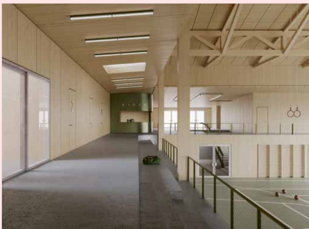
Mehrzweckhalle Breite, Visualisierung Wettbewerb